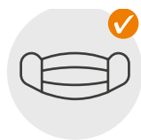
Portez un masque

Nous vous demandons de respecter strictement cette règle. Nous avons mis en place un système de guidage des couleurs sur les terrains et dans les zones de manifestations.