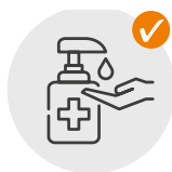
Désinfection des mains

N'oubliez pas le masque et respectez l'étiquette relative aux éternuements et à la toux. Les masques sont obligatoires sur l'ensemble du site selon les règlements des autorités sanitaires. Il peut être enlevé au niveau des sièges et pendant les repas (zones spécifiées). Les dispositions légales s'appliquent à l'exemption du port du masque.