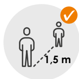
Distance de 1,5 mètres

Les pièces fermées sont régulièrement ventilées et les zones sensibles sont désinfectées avec des moyens appropriés.