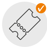
Préparez votre billet

Votre santé et celle de toutes les personnes concernées est très importante pour nous. C'est pourquoi nous avons développé un concept d'hygiène pour assurer une sécurité maximale à tous. Dans ce plan, nous avons résumé tous les points importants. Veuillez respecter les règles suivantes. Nous vous tiendrons informés des mises à jour.